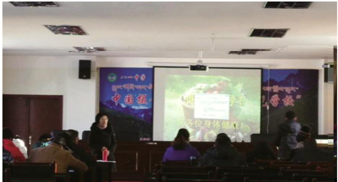
同早 孙AA老师Nw 大组R " 勉 撼 " NI 教研J K