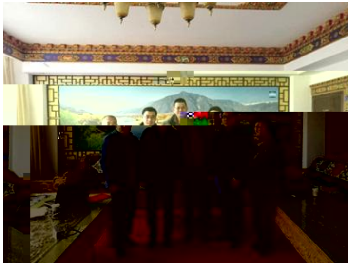
政AA老师q D 地区互LH课 yJK