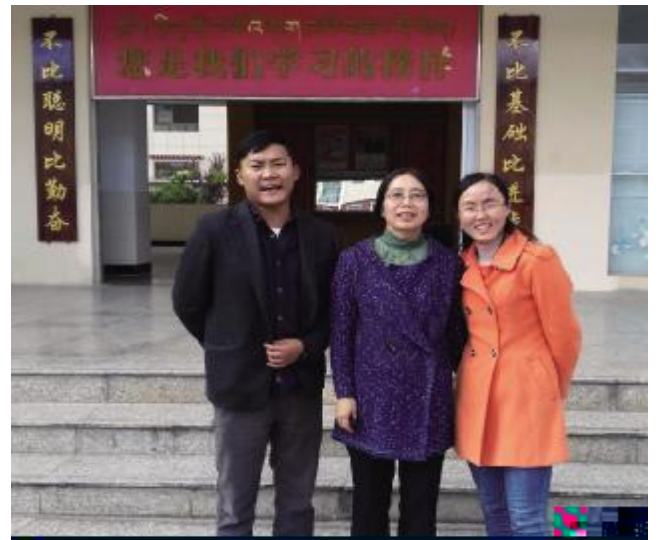
v老师 3B 母 & ( 老师 Q $ RS ? - )