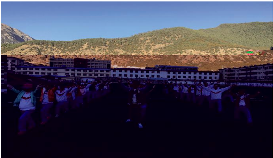
云c老师 学/ 了公N课化 T 辅?